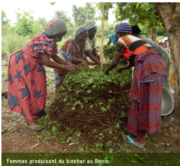
Femmes produisant du biochar au Bénin