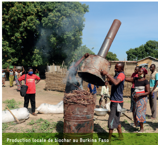
Production locale de biochar au Burkina Faso