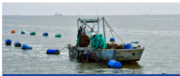
Criação de ostras na baía de Walvis Bay, na vizinhança directa de uma zona húmida de importância internacional ao abrigo da Convenção de Ramsar e de infra-estruturas portuárias.

300 000 km 2 adicionais sob gestão baseada no Ordenamento do Espaço Marinho (MSP), incluindo disposições sobre gestão da biodiversidade e pesca sustentável.