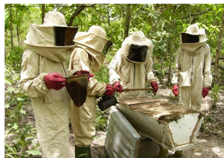
Extraction du miel, Préfecture de la Tchamba, Togo

Les interventions RPF dans les régions F4F ont stimulé le développement socio-économique à travers diverses actions de renforcement des capacités et la création de petites entreprises, visant à améliorer les économies locales et le bien-être des communautés. Les activités du projet ont généré des opportunités d'emploi dans divers secteurs, dont la transformation du bambou, la production de plants, l'apiculture et la culture de la vanille. Des formations sur les pratiques agricoles durables et l'agroforesterie, organisées en Éthiopie, au Togo, à Madagascar, au Cameroun et en Côte d'Ivoire, visent à renforcer les compétences locales et à autonomiser les communautés. Notamment, le développement des chaînes de valeur du miel au Togo, au Bénin, en Éthiopie et au Cameroun vise à accroître les revenus, en mettant l'accent sur l'inclusion des femmes et des jeunes dans l'entrepreneuriat. De plus, le projet en Côte d'Ivoire diversifie les plantations de cacao grâce à l'agroforesterie, ce qui devrait encore améliorer les ventes des producteurs et les opportunités de revenus durables.