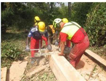
Photo de gauche : Restauration des terres dégradées avec des approches agroforestières