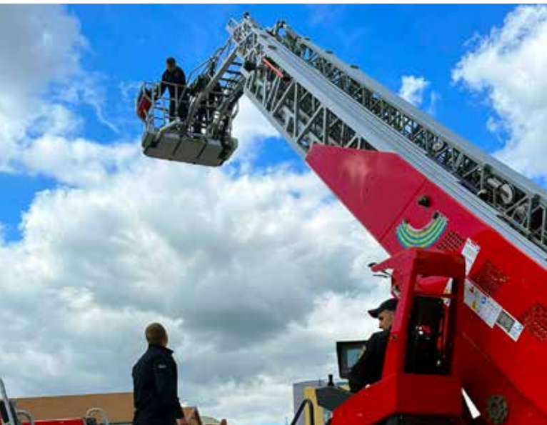
Сучасна техніка: нове обладнання не лише покращує захист населення, а й робить роботу рятувальників безпечнішою.