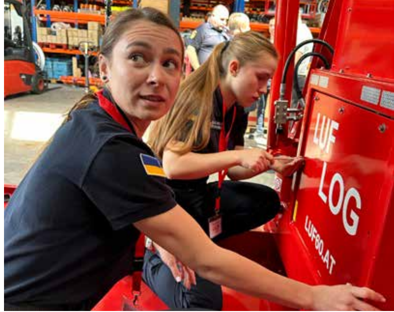
Сильні жінки: ДСНС потребує працівників жіночої статі. Але для їх залучення необхідно покращити умови праці.

Ми є новаторами у розробці нових підходів до ліквідації наслідків надзвичайних ситуацій спричинених повномасштабним вторгненням. Досвід, який наші українські колеги набули за останні понад два роки, має велике значення для відповідних служб у Німеччині та ЄС. Міжнародна співпраця – це шлях з двостороннім рухом.