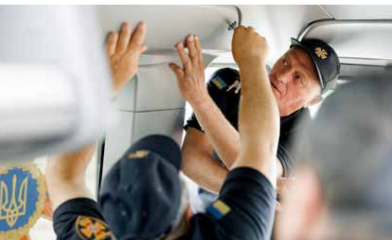
Інтенсивні заняття допомагають рятувальникам швидко та впевнено діяти у надзвичайних ситуаціях.

Головним напрямом наших зусиль є підвищення рівня технічних та фахових навичок рятувальників. Навчання, воркшопи та навчальні візити допомагають посилити їх компетентність в експлуатації сучасного обладнання, що покращує ефективність та безпеку роботи рятувальних служб.