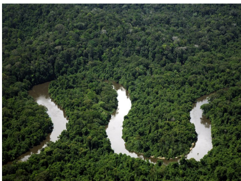
À esquerda: Comunidade do Patauí—RESEX do Rio Unini