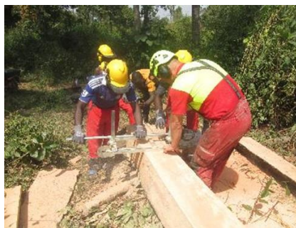
Photo de gauche : Restauration des terres dégradées avec des approches agroforestières