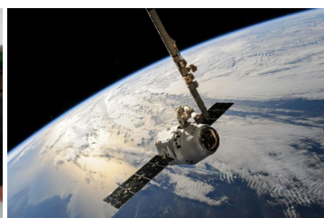
Lado izquierdo (1): Máscaras COVID-19