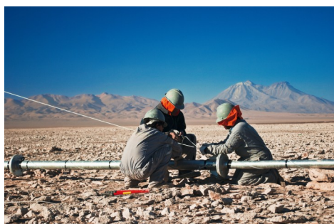
Linke Seite: Windenergie in Brasilien.