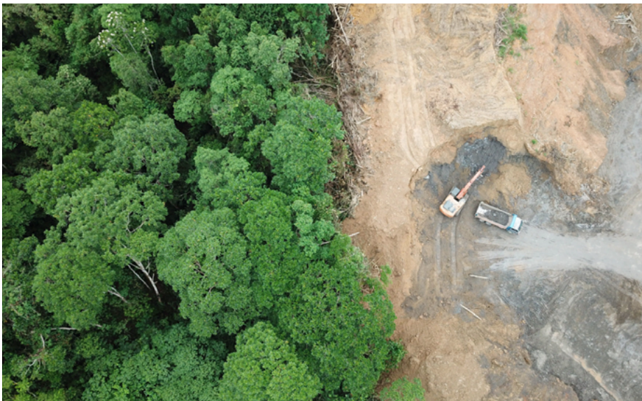
Abbildung 2 zeigt die Abholzung eines tropischen Waldes, um neue Flächen für den Anbau von Agrarrohstoffen zu schaffen. Die EU ist nach China der zweitgrößte Konsummarkt für Agrarrohstoffe mit Entwaldungsrisiko. Dabei konzentrierte sich die durch den Konsum der EU verursachte Entwaldung zwischen 2005-2017 gerade einmal auf sechs Rohstoffe: Soja (31%), Palmöl (24%), Rind (10%), Holzprodukte (8%), Kakao (6%) und Kaffee (5%) (WWF, 2021). Die neue EU-Verordnung gegen Entwaldung (EUDR) soll sicherstellen, dass für den EU-weiten Konsum dieser Rohstoffe zukünftig keine Wälder mehr abgeholzt werden.

Die EU-Verordnung über die Offenlegung nachhaltiger Finanzinstrumente (Sustainable Finance Disclosure Regulation – SFDR) fördert entwaldungsfreie und naturpositive Lieferketten, indem sie die Transparenz und die Rechenschaftspflicht bezüglich ökologischer, sozialer und Governance-Aspekte (Environmental, Social, Governance – ESG) von Finanzprodukten und -dienstleistungen erhöht. 14