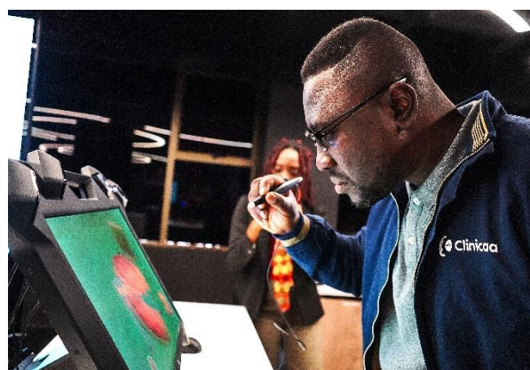
Voyage d'immersion à Cape Town (Novembre - Décembre 2024), Photo : AfricArena © GIZ

Pour renforcer la transformation digitale, le projet vise comme groupes cibles des acteur-ric-e-s du secteur public et privé togolais (start-ups et TPME numériques, les prestataires de service d'accompagnement spécialisés dans le numérique, les TPME non-digitalisées et les expert-e-s et gestionnaires de l'administration publique togolaise).