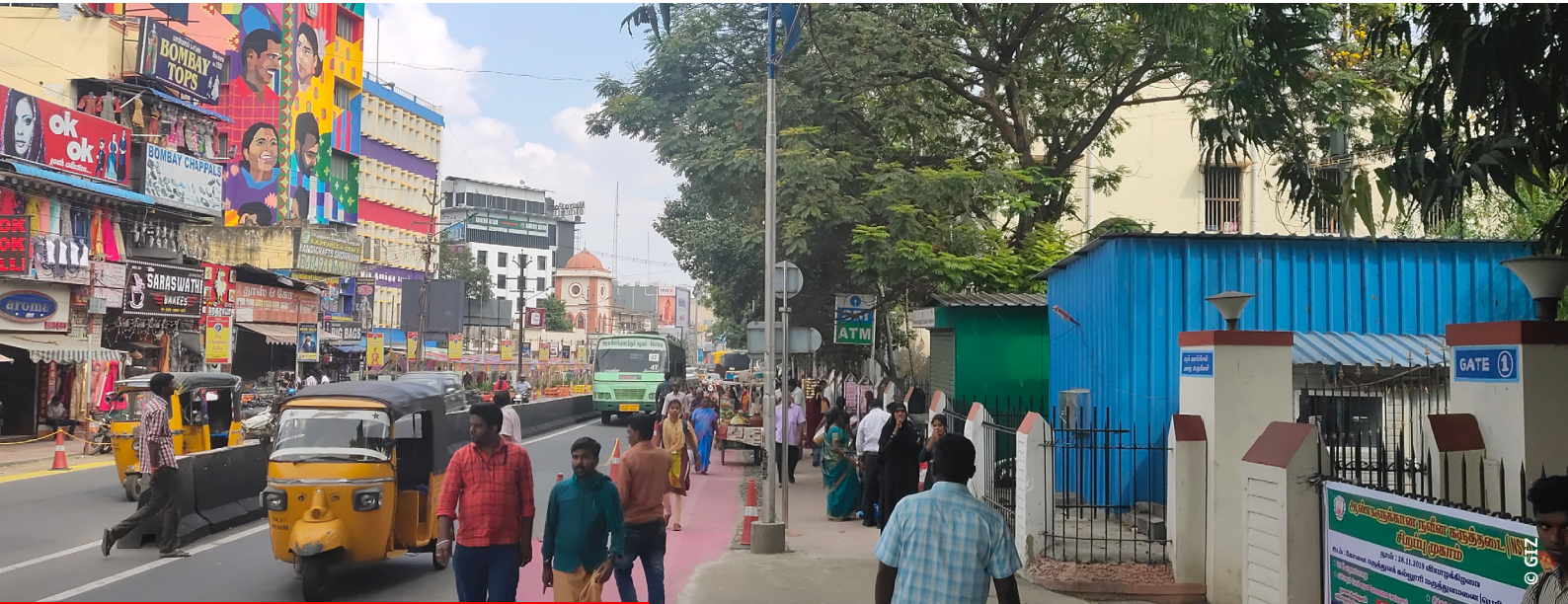
Straßenszene in Indien