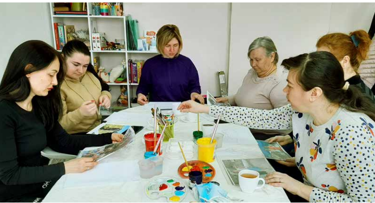
«Мистецький ранч» для жінок у Кам'янській громаді: спільний сніданок поєднується з форматами мистецької терапії.

Окрім цього, ми сприяємо налагодженню контактів у сфері психосоціальної підтримки задля кращого доступу до наявних програм підтримки систем перенаправлення пацієнтів та подальшого розвитку цього сектору. Ще одним важливим пунктом нашої роботи є поширення досвіду та висновків після роботи з ветеранами.