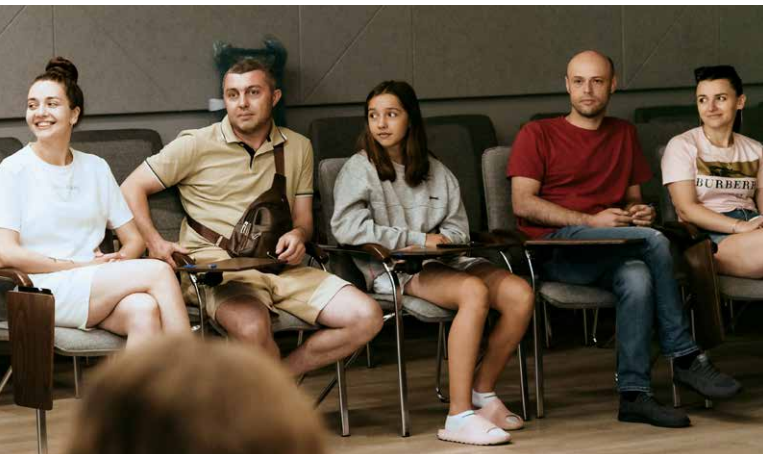
Ветерани разом зі своїми дружинами та дітьми отримують доступ до якісної сімейної терапії.

В Україні бракує гендерно збалансованих підходів до психосоціальної підтримки для ветеранів, внутрішньо переміщених осіб, громадян, які повертаються до своїх домівок, та мешканців приймаючих громад, які також стикаються з труднощами. Країні не вистачає цілісних психотерапевтичних підходів у роботі з такими громадянами та спеціальних навчальних програм у цій сфері.