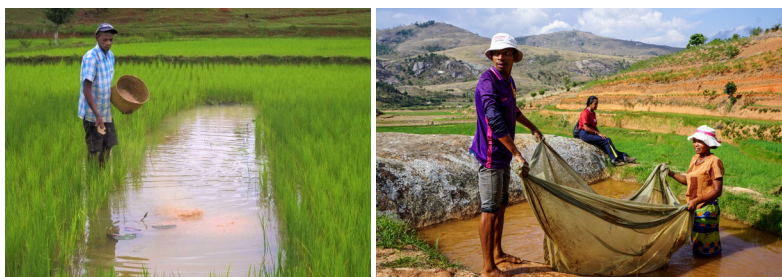
Photo de gauche : « Un pisciculteur nourrissant les poissons en rizière ».

Pour faciliter la diffusion de la pisciculture et accroître la disponibilité des produits aquatiques dans les zones ciblées, le projet renforce les capacités des petits pisciculteurs et des éleveurs d'alevins. Cette intervention a pour but d'augmenter la production de poisson et de faciliter sa commercialisation sur les marchés locaux. La finalité de cette action est de contribuer à améliorer les moyens de subsistance locaux ainsi qu'à répondre à la demande en aliments à haute valeur nutritive.