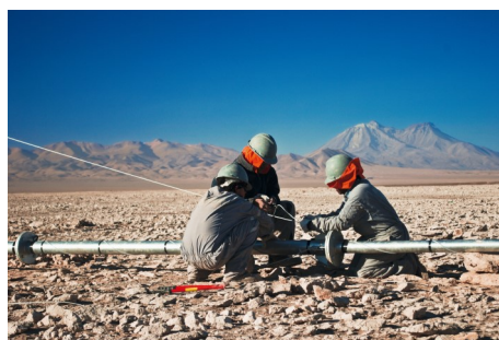
Izquierda: Energía eólica en Brasil.