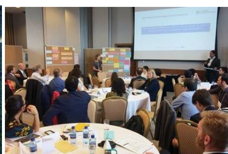
Das Programm Klimapolitik (PoMuC) unterstützt die brasilianische Regierung bei der Erreichung ihrer Klimaziele, insbesondere bei der Umsetzung des nationalen Klimabeitrags.