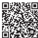
Programm Triple Win