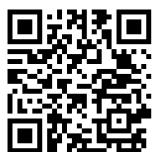
PAM: Partnerschaften für Migration