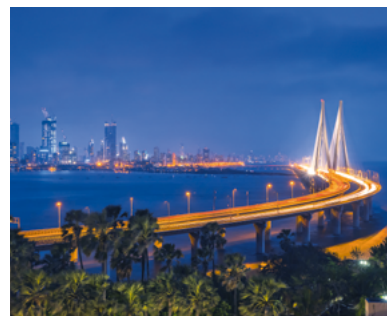
Links: Straßenszene in der Stadt Lucknow aus der Vogelperspektive Rechts: Rajiv Gandhi Sea Link bei Mumbai: Die achtspurige Brücke verbindet die Stadtteile Bandra im Westen und Worli im Süden