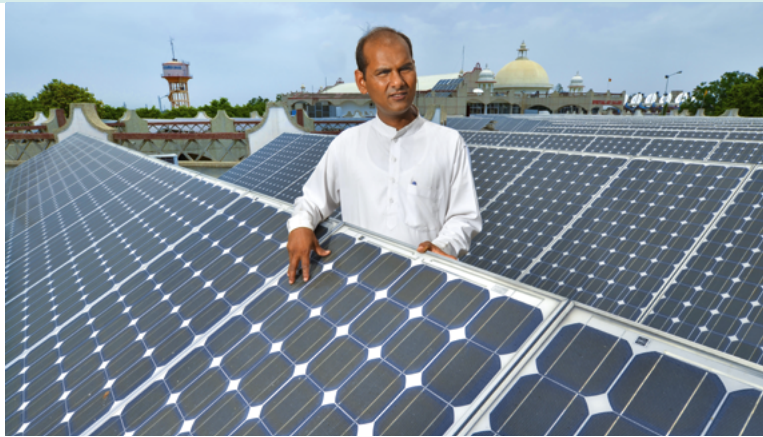
Solarzellen auf dem Dach eines Ashrams