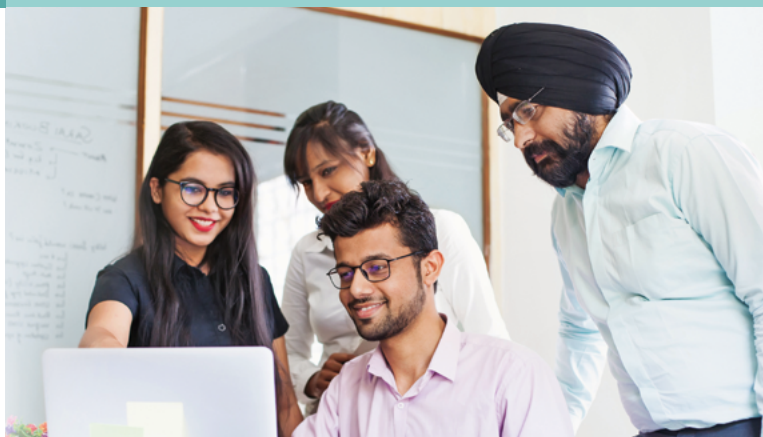
Projektteam bei der Arbeit