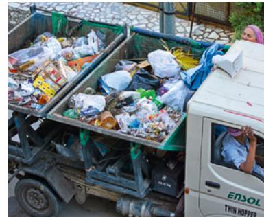
Links: Wasser fließt durch die Schleusen eines Staudamms im Bundesstaat Kerala Rechts: Müllsammung in der Stadt Jodhpur

Indien will im Rahmen seiner 50 Mrd. US$ schweren »Jal Jeevan Mission« bis 2026 in allen Haushalten einen Trinkwasseranschluss legen. Nach wie vor sind fast 120 Mio. Haushalte auf dem Land und 27 Mio. in den Städten nicht an das Trinkwassernetz angeschlossen. Um diese Lücke zu schließen, sind in den nächsten fünf Jahren Investitionen von 80 Mrd. US$ nötig. Indiens Städte und Kommunen geben 20 Mrd. US$ pro Jahr für die Wasser- und Abwasserentsorgung aus. Die kommunalen Versorger sind aber chronisch unterfinanziert und haben kaum Spielraum für Neuinvestitionen. Die Kapazitäten im Wasserssektor reichen derzeit aus, um täglich 70 Liter pro Person bereitzustellen. In Indien gibt es etwa 600 Kläranlagen mit einer Kapazität von 24 Mrd. Litern pro Tag. Davon haben die meisten nur eine mechanische Reinigungsstufe. Das Land will bis 2025 rund 100 Mrd. US$ in den Bau von weiteren 500 Kläranlagen investieren. Damit eröffnen sich Geschäftschancen entlang der gesamten Wertschöpfungskette. Sowohl Lieferanten für Klärwerksausrüstung oder Messtechnik als auch Anbieter von Beratungs-, Planungs- und Designdienstleistungen können von den Projekten im Wasserssektor profitieren. Die Anlageinvestitionen in der indischen Wasserwirtschaft dürften bis 2024 zwischen 5 % und 10 % jährlich auf bis zu 18 Mrd. US$ zulegen, schätzt die Unternehmensberatung EY.