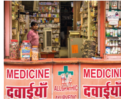
Links: Arzt in Schutzkleidung bei der Impfung einer Patientin Rechts: Apotheke in Neu Delhi