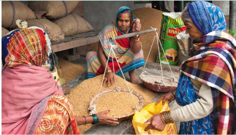
Von Frauen verwaltete Getreidebank